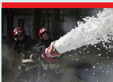
Räddningstjänst - Släckfordon