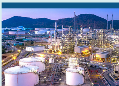
Industri - Sprinkler

Ekonomisk och miljömässig testning med tillvalet Dosering/Returventil (DRV) och två separata flödesmätare.